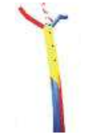
pagliaccio 7 metri