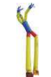
figura a 2 gambe 10 metri classica