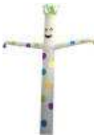
dancer 5 metri