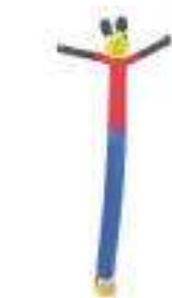
topolino 7 metri