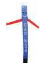
dancer 5 metri