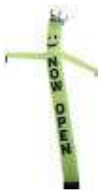
dancer 5 metri