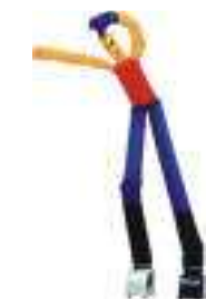
figura a 2 gambe 10 metri classica