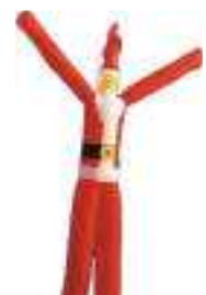
figura a 2 gambe 10 m. babbo natale