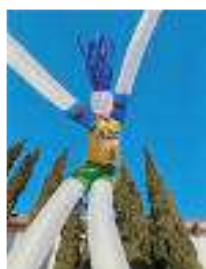
figura a 2 gambe 10 metri