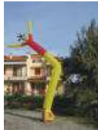
Mono figura classica