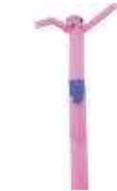
mono figura 7 metri bambino