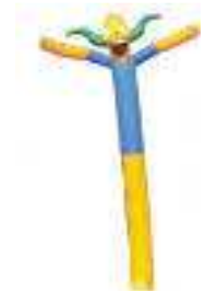
clown 7 metri