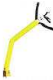
mono figura classica