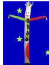
dancer 5 metri