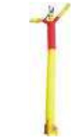
mono figura classica