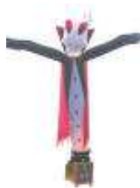
draculino 4 metri