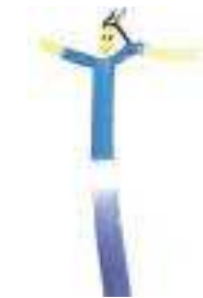
mono figura 7 metri