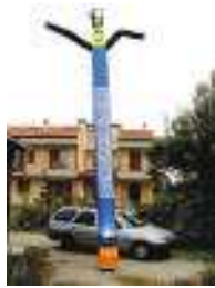
Mono figura 7 metri